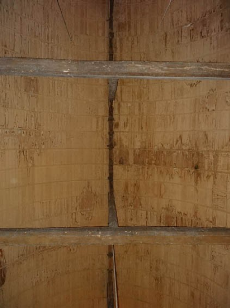
Saint Etienne l'Allier